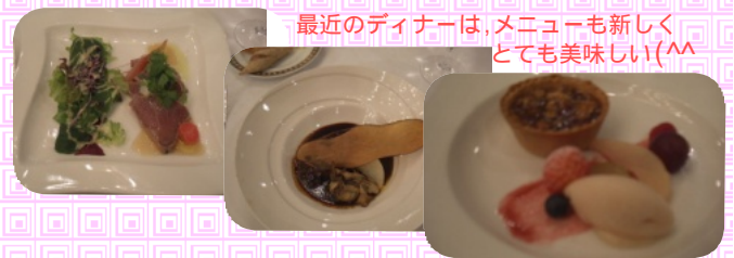
最近のディナーは、メニューも新しくとても美味しい(^-^)