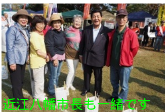
近江八幡市長も一緒に

近江八幡市の宮ヶ浜（休暇村）で10月24・25日の両日、がんの征圧とがんと闘う患者を支援するチャリティイベント「リレー・フォー・ライフ」があり、湖畔に設けられたウォークトラックを24時間歩き続けるもので、特設ステージでは消防音楽隊やグループによるギター演奏、歌声などが開催され、家族連れや老若男女の多くの参加者でした。私達もいい天気の下で各病院や団体のがん患者等への応援メッセージ旗と共に歩き続けていると、近江八幡ワイズメンズクラブの方達と合流しました。昼食は木陰でワイズ仲間と飲食ブースで購入した「そば弁当」で、美味しい時間を過ごしました。その後、トラックに戻り、がんと闘い亡くなった方のご家族や痛みに向き合っている人達に思いを馳せる多数の灯のルミナリエバッグに書かれた「お母さん、よくがんばったね。見守ってね」等を見ながら歩き、胸に詰まるものがありました。会場では健診バスによる無料の乳がん検診と肺がん検診が行われており、私は肺がん検診を受けました。蒲生野ワイズメンズ