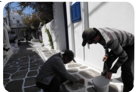
ミコノス島でペンキ屋さんになるンて観光名所となっ

トルコはキリストの死後、十二弟子をはじめ聖パウロが伝道された地で、その遺跡や足跡を聞いて、その当手を想像することができてとても喜びがあたえられた。港からバス観光で「エフェソス(エペソ)遺跡」を見学した。大都市の中、広大な遺跡で大劇場、ケルスス図書館、公衆トイレ、浴場などや、すばらしい神殿跡の数々であった。入口から出口まで3時間の長い歩行観光で、エフェソスを満喫した。船はエーゲ海を横断してギリシャのミコノス島に到着。このミコノスはエーゲ海の中でも一番美しい島で家は白。窓はエーゲブルー。石畳は白い模様で塗られていた。私も一寸ペンキ屋さんを手伝った。丘の上の教会と風車、町並み、入り組んだ細い小道とお店。私達はしばしエーゲ海の島を楽しんだ。海辺の砂浜に五ツの風車があっ