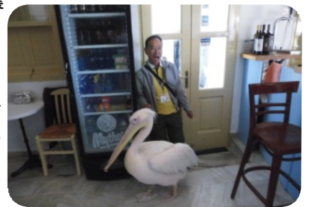
ミコノス島でピンクのペリカンと記念撮影

ていた。ピンクのペリカンも飛来し、すごく心に残った地であった。もう一度、島々の風景を見てすばらしいエーゲ海を脳裏に覚えさせた。